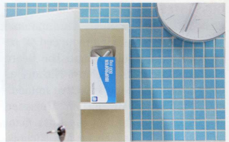
Stora Enso's Kartonsorte Tambrite

Stora Enso's Kartonsorte Tambrite ist nach einem nunmehr abgeschlossenen Investitionsprogramm im finnischen Werk Ingerois hochwertiger denn je.